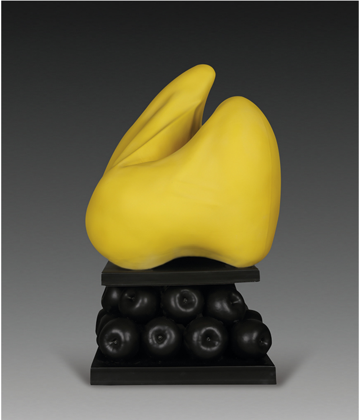
"Banana & Co", 2016-2017. Porcelain, 42 x 40 x 47 cm. Musee Ariana.

Musée Ariana, Ville de Genève 10 avenue de la Paix CH – 1202 Genève, Suiza