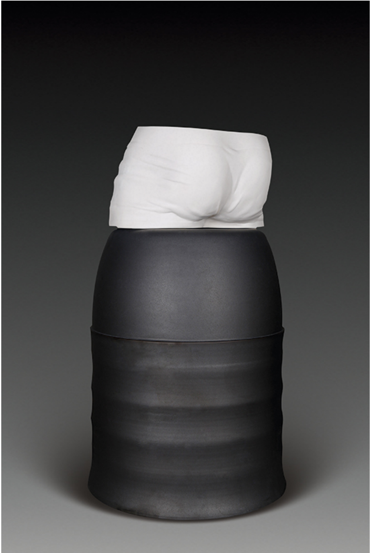
"Accessories of Masculine Seduction", 2016-2017. Porcelain, 67 x 42 x 42 cm. Musee Ariana.