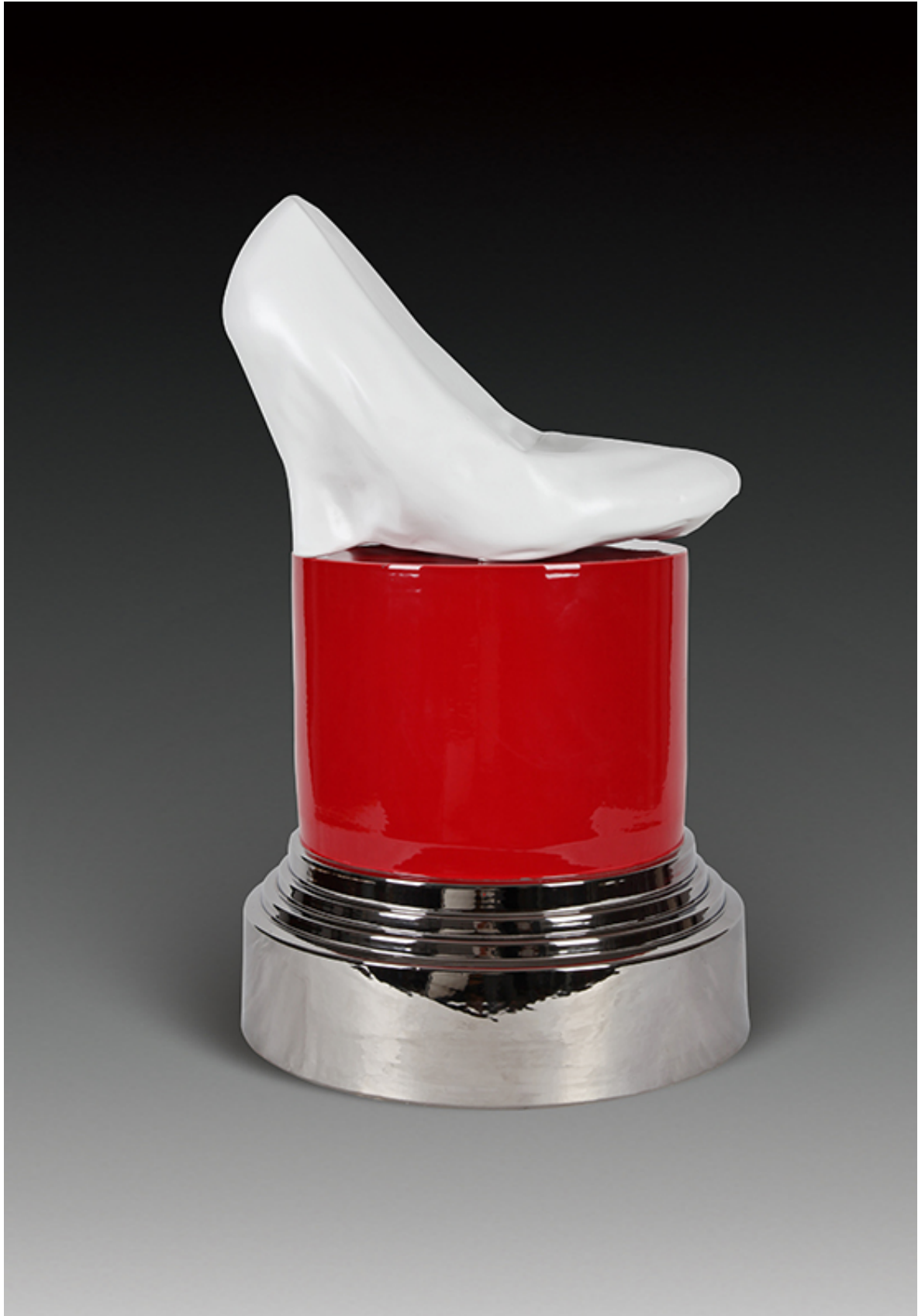
"Accessories of Feminine Seduction", 2016-2017. Porcelain. 67 x 42 x 42 cm. Musee Ariana