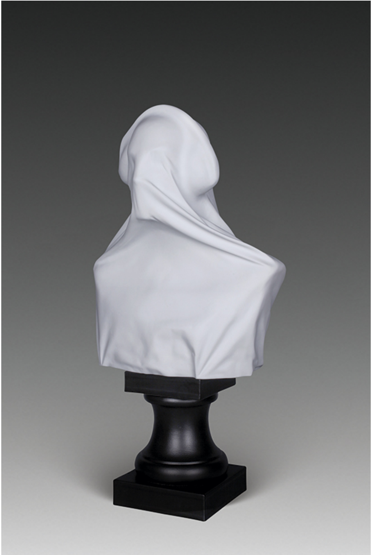
"Can't hear", 2016-2017. Porcelain, 81 x 40 x 20 cm. Musee Ariana.