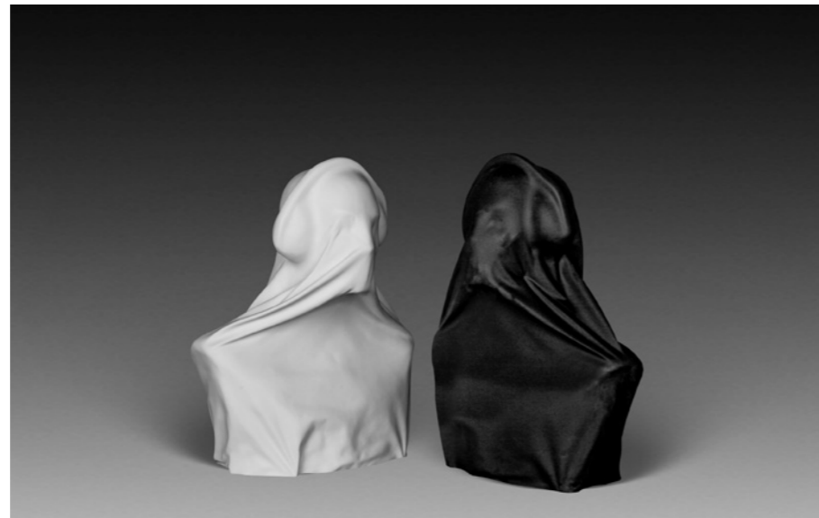
can't hear/can't talk (ensemble)

Mais aujourd'hui, les valeurs ont changé. Que choisit-on de mettre sur un piedestal? s'interroge l'artiste. L'expression prenant également un sens propre dans le travail